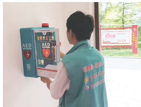
即墨区百台AED上岗。资料图