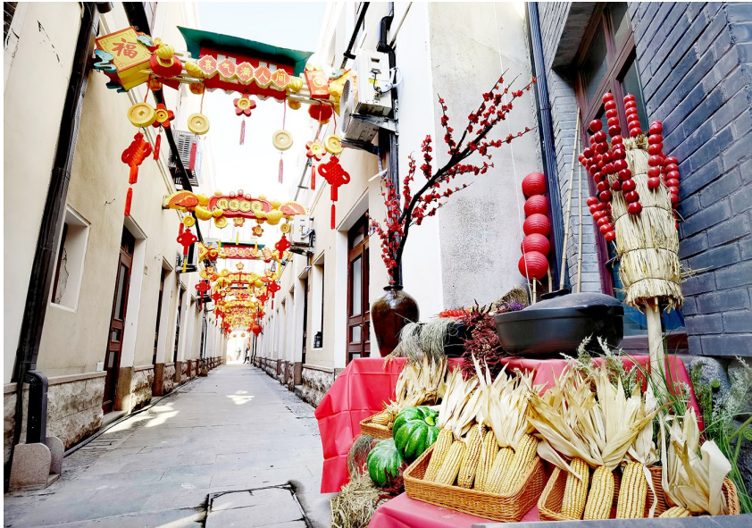
临近春节,劈柴院年味浓。

项目因涉及保护性建筑,对具体设计、施工提出了较高要求。不仅要注重保持地块原有的街巷空间肌理,梳理地块内各历史建筑、风貌建筑的价值定级