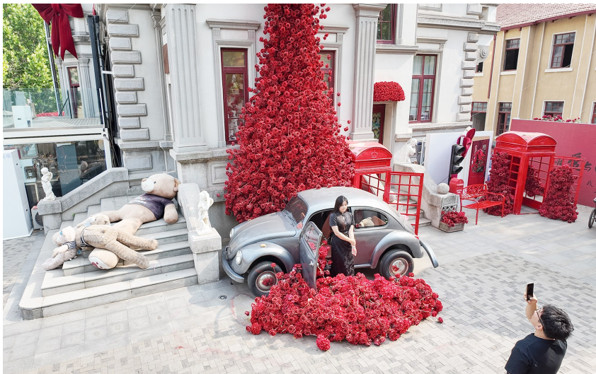
位于浙江路的安娜别墅成为年轻人心目中的“全国最美婚姻登记处”。