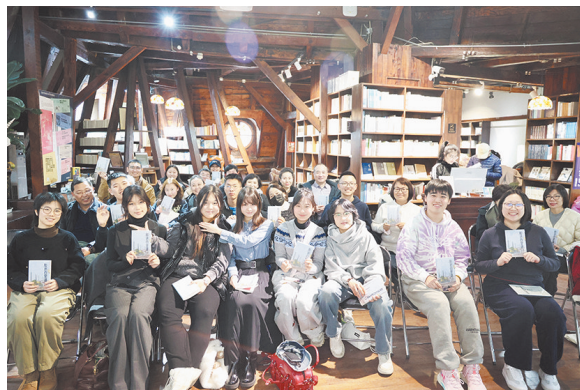
《胶济百里道》在新年亮相。

从寒冬到盛夏，少年们在指导老师的带领下，通过专题学习、实地探访、现场记录等方式，深入胶济铁路沿线的重要历史现场。他们以脚步丈量铁路的百年变迁，用文字记录工业遗产的温度，最终完成了近十二万字的调研报告。