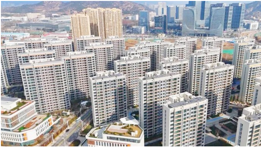
张村社区回迁安置区。资料图

从“住有所居”到“住有优居”,张村河片区的居民正亲身经历着生活环境的沧桑巨变。钥匙的交付,开启的是一扇扇崭新的家门,更是一段段幸福生活