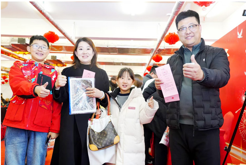
张村居民喜提新房。