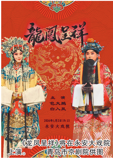
《龙凤呈祥》将在永安大戏院上演。