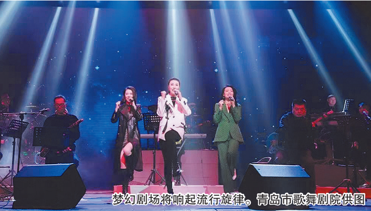
梦幻剧场将响起流行旋律。

在剧场的欢乐中迎接新年。元旦前后,法语原版音乐剧《莫里哀》领衔重磅演出阵容,携手新年音乐会、流行演唱会、青少年艺术展演、亲子儿童剧及传统京剧,在青岛大剧院、青岛市歌舞剧院梦幻剧场、青岛永安大戏院等场馆共同构筑起多元艺术矩阵,让岁末年初的岛城浸润在狂欢与温情交织的艺术氛围中。