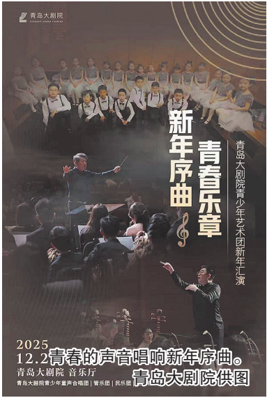
2025 12.2青春的声音唱响新年序曲。青岛大剧院 音乐厅 青岛大剧院青少年艺术团新年汇演

与此同时,亲子剧场也是假期的热门选择。2026年1月1日至2日,青岛市话剧院口碑佳作《小鲤鱼跳龙门》将在青话小剧场连演三场。该剧以经典神话为蓝本,赋予传统故事新时代内涵。剧中,主人公国泰与安安带领伙伴化身鲤鱼,为守护家园逆流而上跃过龙门,通过人偶合一的表演形式,戏曲水袖与古典舞蹈的巧妙融合,营造出“水袖波涛”场景,让孩子们在沉浸式体验中理解团结、勇气与责任的意义。