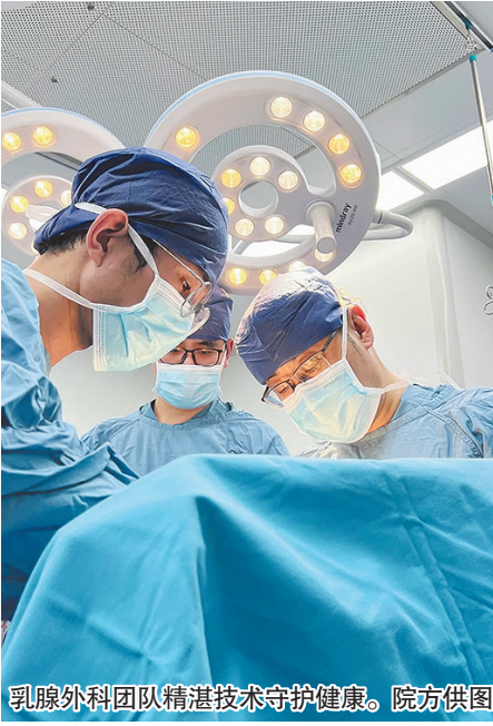
乳腺外科团队精湛技术守护健康。