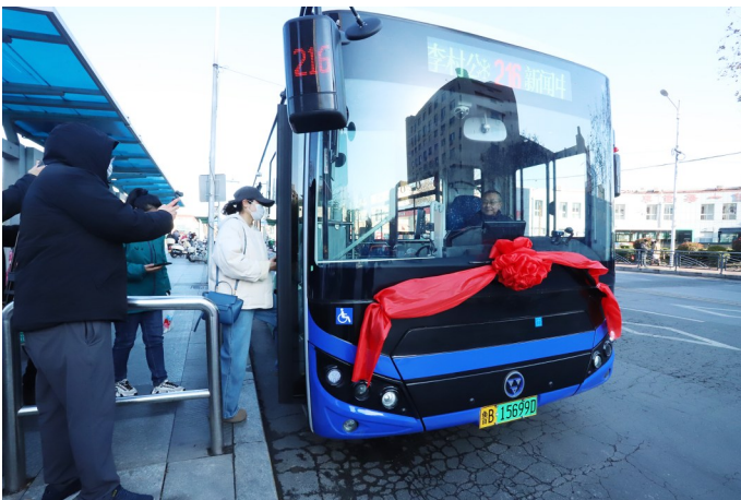
更新公交车24日率先在114路、216路等上线运行。

在便民服务方面，新车充分考虑特殊乘客群体需求，站立区域实现“0”台阶全平地板设计，方便老年人、儿童、残疾人等特殊群体上下车。车辆配备轮