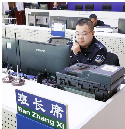
民警在联系湖南郴州警方。

本报12月5日讯 父亲到平度打工失联近一个月后，忧心忡忡的女儿从河南打来报警电话。平度公安立刻行动，在湖南郴州警方的协助下，帮她找到了父亲。