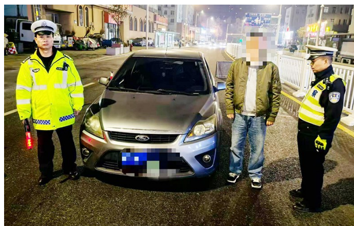
林某被交警民警查获。

本报12月5日讯 11月23日晚，市北交警九中队民警在南京路设卡夜查时，查获一名心存侥幸酒驾上路的司机。