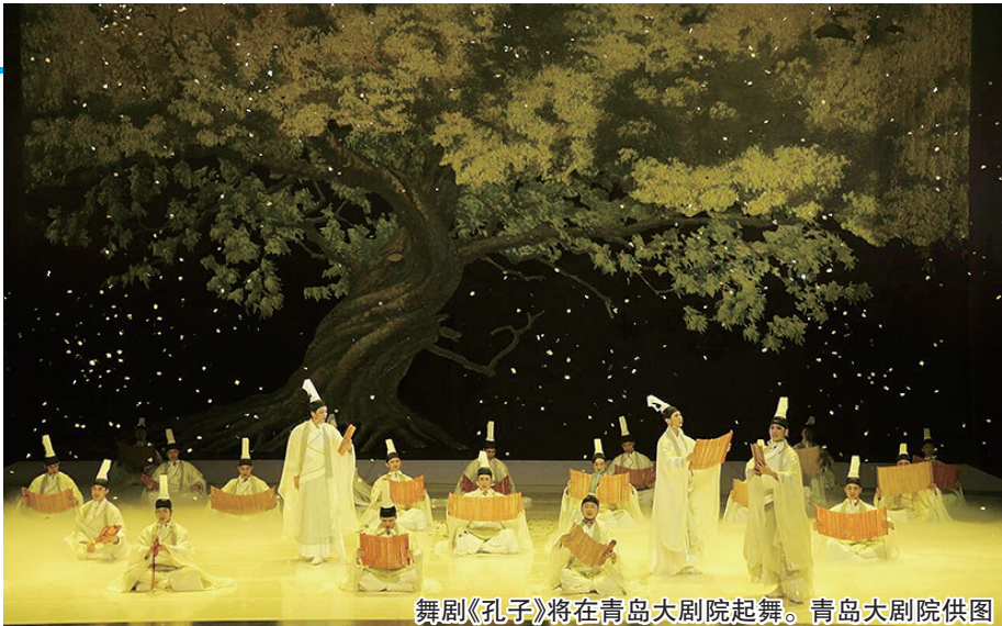
舞剧《孔子》将在青岛大剧院起舞。

冬日青岛,文艺气息日渐浓厚。12月第一周,岛城剧场迎来演出小热潮——青岛大剧院、李沧剧院、永安大戏院三大场馆同步发力,推出多场高品质演出。其中,中国歌剧舞剧院倾力打造的舞剧《孔子》以史诗质感领衔登场;山东歌舞剧院与青岛市歌舞剧院联合呈现的《泉海乐鸣》民族音乐会,则以跨界合作之姿成为声乐类演出的核心亮点。此外,流行音乐会、经典歌曲合唱等多场演出各具特色,共同为市民带来涵盖古典舞、民族乐、流行曲的多元艺术体验。