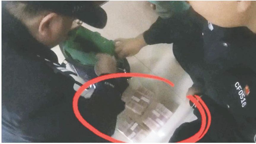
民警清点发现包里装着30万元现金。

民警仔细检查包内物品后发现,蓝色公文包里装着一个绿色袋子,里面整齐地放着30万元现金。此外,包里还有一个信封,民警根据触感和形状判断,里面应该是一张手机卡。民警清点现金并做好详细记录后,去物业调取监控,并通