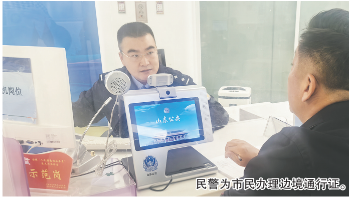
民警为市民办理边境通行证。

近年来,以《我的阿勒泰》《大风杀》《无人区》为代表的一批西部题材影视剧热播,影视剧里的戈壁滩、胡杨林和沙漠绿洲等意境,让很多人想去祖国的大西北领略别样风情。多家航空公司和铁路部门,已经开通从青岛出发的相关航线或客运线路。根据我国相关法规,国家在陆地边境地区划定边境管理区,如果要前往这些地方,必须到公安机关办理《中华人民共和国边境通行证》(以下简称边境通行证)。11月上旬记者从公安机关了解到,近年来,办理边境通行证的市民不断增多,公安机关也推出多项举措,方便市民办证。