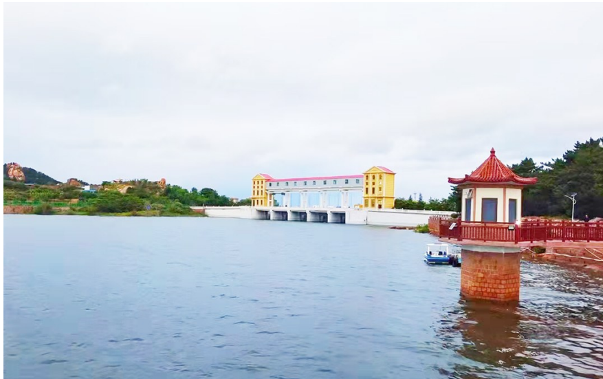
我市全力推进市级现代水网示范区建设。

2023年以来,我市共实施169项省市重点水利工程,水网投资连续三年迈上新台阶,累计完成投资263.12亿元,投资完成额度是2019-2021年的2倍,