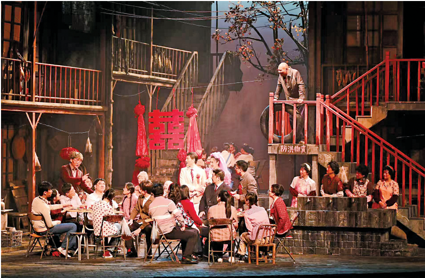
《烟火人间》讲述青岛故事。

细节复刻时代,烟火气唤醒集体记忆。该剧的动人之处,首先在于对生活细节的精准捕捉。晾衣绳上的风干海带、烧得通红的煤球、冒着蒸汽的开水房、吱呀作响的二八大杠自行车,再加上青岛大姨们鲜活的方言,每一个场景都