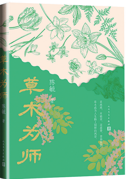
陈毓 著 人民文学出版社 2025年8月出版

陈毓在书中写道:“时间流逝,季节更替,时序流转,顺其自然。或许就有奇迹。”草木为师,它们用开花的坚持告诉我们厚积薄发,用落叶的坦然教会我们接纳变化,用四季的循环提醒我们成长有自己的节奏。