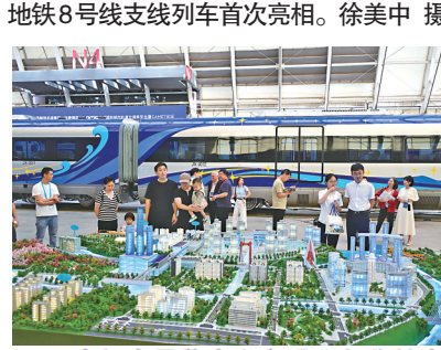
人们在展览会上参观。