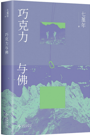
七堇年 著 新星出版社 2025年9月出版

书名“巧克力与佛”，既是第一个故事的篇名，也源自作家杰克·凯鲁亚克书里的一个细节：主角在一次爬山过程中又累又饿，快要不行了，他非常想吃一块巧克力。这时候，他的朋友说，这块巧克力，就是你的佛。凯鲁亚克写了一群天真又迷惘的年轻人，借助朴素而自由的生活，去反抗资本主义“工作—生产—消费”这一闭环式牢笼。 这是如年轻人同样面对的议题，也是七堇年这部小说集的精神内核——有人醉心于户外，在身体上挑战地心引力，却逃不出社会框架的牵引；有人被固定在两点一线和朝九晚五，在风平浪静的日常里，经历内心的跌宕起伏。固然我们的文化并不鼓励失败，但这本书想告诉你：人有巨大的弹性，去适应各种各样的生活。不走大路的人，在世界上也有自己的位置。 本书收录篇目《火空海》，获《当代》《收获》“年度中篇小说”。 在反复的尝试和反复的失败中，英雄式的激越被证明不过是人类中心的臆想，接受一种存在即是过程的价值观，是这部作品重要的意义指向。