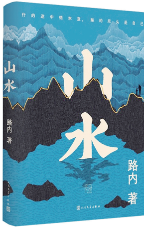
路内 著 人民文学出版社 2025年8月出版

《山水》是路内全新长篇小说力作，深沉回望历史，胸有山水，道路宽广。 小说以司机路承宗与妻子周爱玲从抗战烽火到改革开放时代横跨五十载的生死相守为主线，辅线铺展收养五个孩子温情与欢笑交织的往事，以一个特殊家庭的冷暖悲欢折射出半个世纪中国的变迁，见证着个体命运与时代史诗的磅礴共振。 书中写到，“吴里人所谓的‘看山水’有两层意思，一指此人目光高远，胸怀大不一样，二指冷静隐忍，善于鉴貌辨色。无论哪层意思，会看山水的人，总强似不会的。承宗很小的时候，他父亲二祥就说过：你啥都不会，这辈子要学会看山水。现在他知道，就算学会点东西，也得看山水。” 《山水》是另一种意义上的“活着”。无论面临什么样的丧失与离乱，风险与危机，活下来并且尽量照顾旁及之人，这未尝不是一种伟大，一种中国文化底部的韧性所在。路内的“活着”自始至终有一种更为松弛的幽默感。