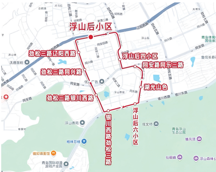
429路微循环公交线路图。

当天新开通的430路也是一条微循环，线路以清泉路站为起止点，串联起清泉路、塔山路、九水西路、常宁路等多个居民集中区域。线路从清泉路始发站出发，沿清泉路一路前行，途经塔山路后，再经九水西路、常宁路、黑龙江南路等主干道，最终又回到清泉路车站，全程3.2公里。