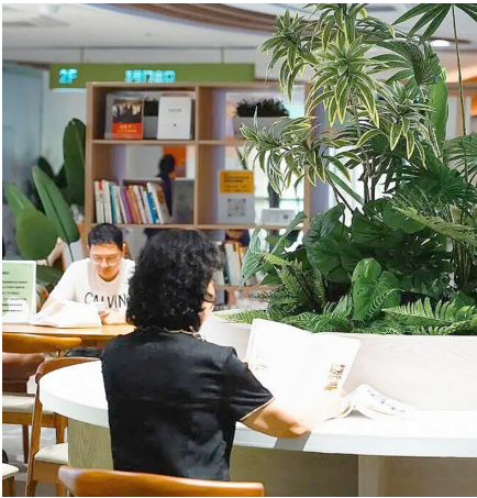
畅享汇·海信桥共享空间。

海信桥站位于延安三路、台湛路合围区域，周边聚集着海信·都市阳光、天泰阳光地带、台湛路小区等居民社区，中联U谷2.5产业园等商业园区，还有台湛路小学等学校。在这样的中心城区建地铁站，常见的做法是将其点缀为口袋公园，而青岛地铁却有别样的尝试——将站口土地建成精准服务周边社区居民的小型商业综合体，畅享汇产品线应运而生。