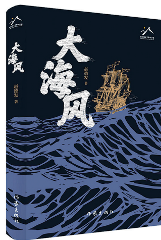
赵德发 著 作家出版社 2025年1月出版

但这种“转换”不是割裂的。在《大海风》里,农耕文明与海洋文明始终在“互相参照”:邢昭衍的父亲以拥有土地为荣,觉得海上讨生活不安稳,出海时总要揣个“面兔子”——“有地的渔民揣着面兔子,摸一摸就安心,就算打不到鱼,还有土地兜底”;书中人物郭桂英到了海边,看着渔民与鱼虾,