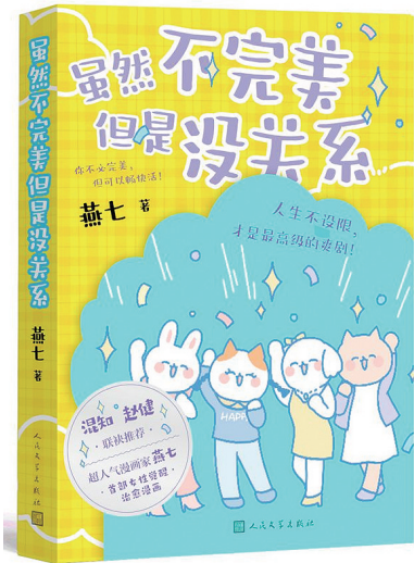
燕七 绘著 人民文学出版社 2025年8月出版

破重围,找到舒适而有意义的生活路径。她借助“女孩帮助女孩”“勿忘最初的心意”“健康的情感”等情节为困境打开一扇光明的窗,同时以“让学习和进步成为自己的底气,从而勇敢坚定地追求美好畅快、不设限制的人生”“先看到对方的那个人,也容易被对方看到,力的作用是相互的”等充满成长智慧的金句,照亮值得拥抱的未来。