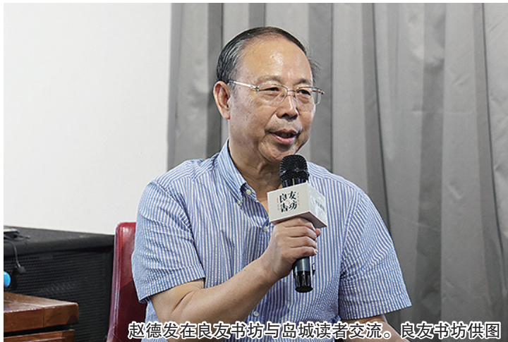
赵德发在良友书坊与岛城读者交流。

作为青岛文学馆开馆十周年暨全国作家交流系列活动的首场,“《大海风》和当代文学形象的现代化再造——赵德发新作研讨会”在青岛文学馆成功举办。作家赵德发、本书责任编辑兴安与多位学界嘉宾齐聚一堂,共同探讨《大海风》历史叙事中的当代精神,挖掘海洋文明与现性之间的深刻联系。