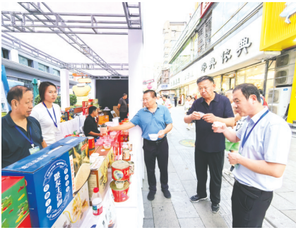
琳琅满目的农特产品集中推介销售。

现场布置的“青岛优品四季飘香、薯都宽粉匠心传承、陇蜀味道回味无穷、菏泽牡丹花开盛世、生态夷陵山水画卷、