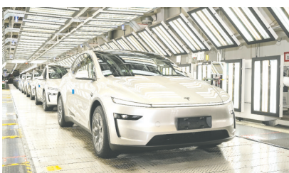
Model Y L工厂下线。

本报9月4日讯 9月3日,特斯拉全新六座SUV Model Y L在青岛开启全国首批交付,同步交付的还有Model 3长续航后轮驱动版。