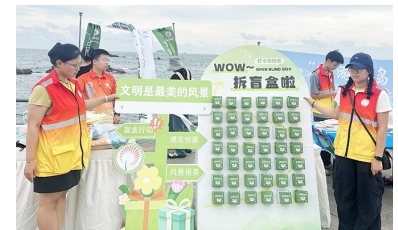
游园活动播撒文明种子。崂山区供图

本报8月31日讯 日前,一场以“畅游青岛 文明相伴”为主题的文明游园活动在崂山风景区大河东游客服务中心开展。本次活动吸引了众多游客参与,成为青岛推动文明旅游、提升城市文明程度的生动实践。