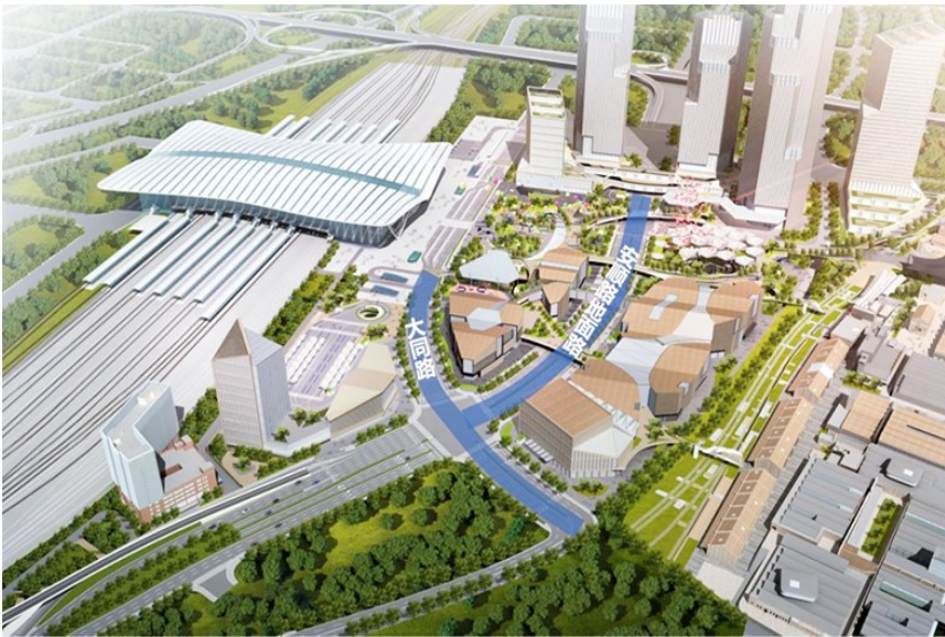
大同路(原站前路)及安顺路地面道路效果图(蓝色为此次通车路段)。

作为集高铁、地铁于一体的交通枢纽,青岛北站日常承担着巨大的旅客和车辆通行压力,东广场站前区域交通状况一直备受市民关注。本次通车的大同路与安顺路地面道路,是当前阶段缓解区域交通压力的核心工程。其中,大同路(原站前路)此次开通路段总长约240米,宽约30—40米,采用由北向南单向通行设计,旨在构建高效、流畅的快速进出站通道;安顺路本次拟开通地面道路总长约580米,宽约42—46米,与大同路(原站前路)协同形成青岛北站交通“微循环”体系,显著提升区域通