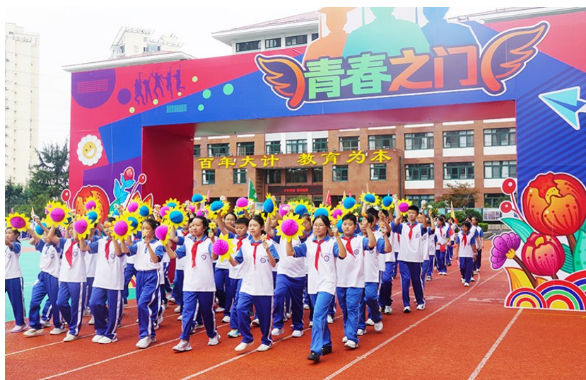
开学典礼上，青大附中初一新生踏入“青春之门”。

听一听自己内心的声音，深思熟虑后再做出决策”；善良比聪明重要，“那些我们传递的温暖与善意，最终也会温暖并滋养我们自己”；过程比结果重要，“学会珍惜当下过程中的每一个瞬间，人生没有白走的路，每一步都算数”；成为自己，比什么都重要，“成为自己、认可自己，定能绽放出属于自己的光芒”。展望新学期，他祝愿同学们做坚定的行动派，真实善良，勇敢无畏，眼中有光，“也许我们生而平凡，终其一生都成不了真正的英雄。但我们可以用笨拙的努力、不懈的坚持、善良的初心，活成自己的‘齐天大圣’。”