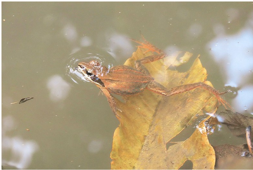
大泽山记录到的韩国林蛙。

生物多样性,不仅维系着地球的生机与活力,更是人类社会实现可持续发展的关键支撑。记者从青岛市生态环境局获悉,青岛市生物多样性保护优先区域生物多样性调查评估项目(大泽山、浮山一期)已经顺利通过评审验收。该项目自2024年5月启动,由青岛农业大学、青岛市观鸟协会、青岛市环境保护科学研究院承担,主要通过科学的调查,初步完成大泽山和浮山优先区域生物多样性本底调查,包括陆生高等植物、陆生脊椎动物、昆虫、大型真菌的种类、珍稀濒危状况等,成果丰硕。