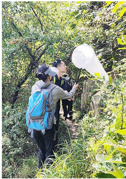
野外调查现场。