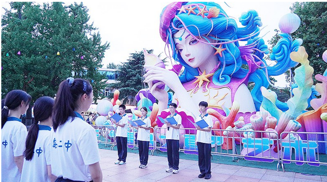
学生代表朗诵《山海百年 光耀二中》向母校献礼。

灯光与歌声交织的现场,特意从市北区赶来的市民章先生对灯会的艺术性与二中元素的结合赞不绝口:“灯美,词更美!看这些孩子,自信大方,才华横溢,这就是祖国未来的样子。”夜色渐深,光影流转的中山公园成了欢乐的海洋。仪式结束后,意犹未尽的学生和市民流连于各色灯组之间,二中的学子,在象征母校的灯牌前留下珍贵的合影,青春的笑靥与身后的“青岛二中·百年校庆”字样一同被定格。