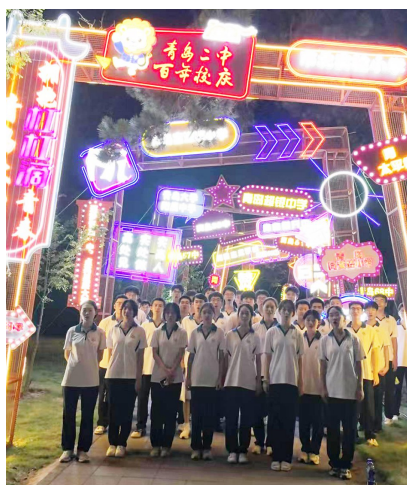
二中学生在母校的灯牌前合影。