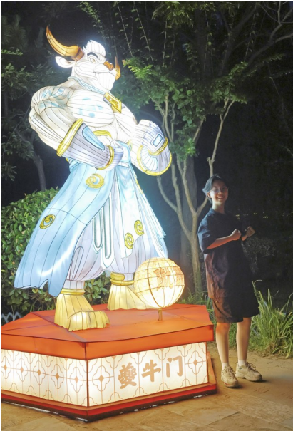
属相牛彩灯造型雄健有力。“牛”气。”市民孙先生告诉记者。

《武林生趣》灯组将传统十二生肖解构为武林各大门派的“功夫化身”，每位市民和游客都可以在这里找到自己对应的生肖彩灯。“功夫”生肖各自对应独特的功夫流派，比如生肖鼠为“灵鼠门”，生肖牛为“夔牛门”，生肖虎为“猛虎门”……这些生肖灯组运用了夸张的制作手法，十二生肖或紧握双拳，威风凛凛；或手持兵刃，灵动机敏。特别是生肖牛的造型，昂首挺胸、表情坚毅，给人“牛”气冲天的感觉。“我是属兔的，但是我还想在牛的灯组前照一张，沾沾