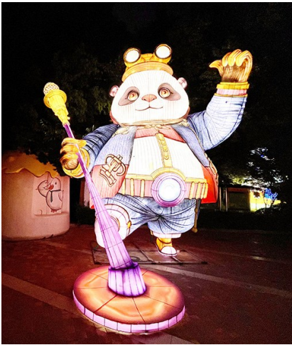
蒸汽朋克风格的“机械熊猫”。