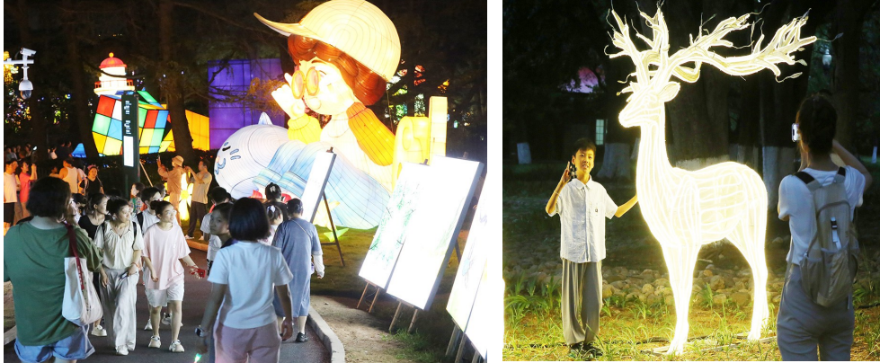
万盏彩灯织就成一幅幅梦幻画卷。