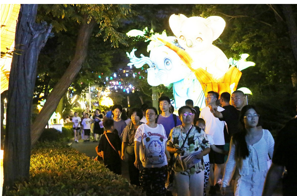
2025年“青岛之夏”艺术灯会启幕。