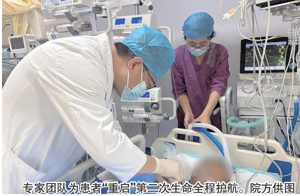
专家团队为患者“重启”第二次生命全程护航。

日前,青岛市市立医院心脏中心借力多学科诊疗模式,成功为一名终末期心衰患者完成全磁悬浮人工心脏(LVAD)置入术。手术的成功,标志着医院实现终末期心衰综合救治领域里程碑式的跨越。迄今为止,市立医院以人工心脏置入技术照亮3位终末期心衰患者的重生之路。