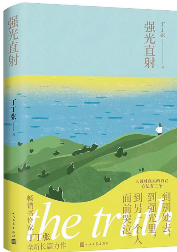
丁丁张 著 人民文学出版社 2025年6月出版

的鲜活感。丁丁张以犀利幽默的笔触，刻画了都市人在高压下的窒息感：“上班的意义不止是赚钱养家，更主要是借机离开家”；同时通过宋春风的觉醒，传递出“温柔要有爪牙”的女性力量。书