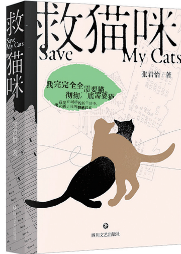
张君怡 著 四川文艺出版社 2025年4月出版

这本书里没有宠物文学常见的柔光，只有出租屋里混杂着消毒水与猫砂气味的真实：带着猫咪往返医院的深夜，治疗费用的巨额数字带来的心悸，还有在凌晨相拥着无声流泪