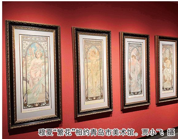
穆夏“繁花”相约青岛市美术馆。