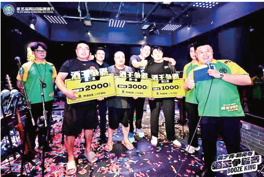
首场预热赛三名选手直通决赛。