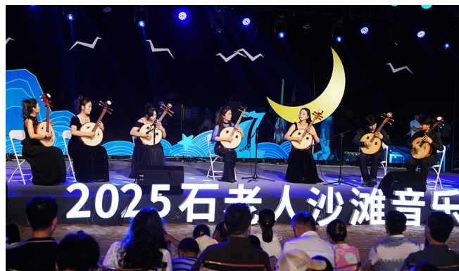
“新潮音 Yue 崂山”2025石老人沙滩音乐季开幕。

姿演绎崂山灵气,小合唱《福佑崂山》唱出对这片山海家园的深情礼赞。二胡重奏《新赛马》奔腾激越,中阮齐奏《丝路驼铃》空灵悠远,古老器乐在滨海夜空焕发新生,彰显“时尚音乐季”的融合魅力。男女四重唱《共筑中国梦》磅礴大气,最终在全场观众自发起身,挥舞手臂齐声高唱《歌唱祖国》的恢宏声浪中,音乐会圆满落幕。这一刻,个人情感、城市自豪感与爱国情怀在石老人的涛声里达成强烈共鸣,将“音乐海岸线”的符号深深镌刻在每位参与者心中。