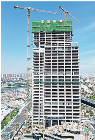
青岛国际邮轮港区航运中心项目主体结构封顶。

主体结构部分采用大量型钢混凝土柱、型钢混凝土梁，吊装体量大、难度高，共计约1900吨，采取分段吊装，合理规划。针对项目装配式构件施工、型钢梁施工等重难点施工问题，通过优化施工组织、采用BIM技术优化等方式，攻克困难点。此次封顶是航运中心项目建设过程中的重要里程碑节点，为后