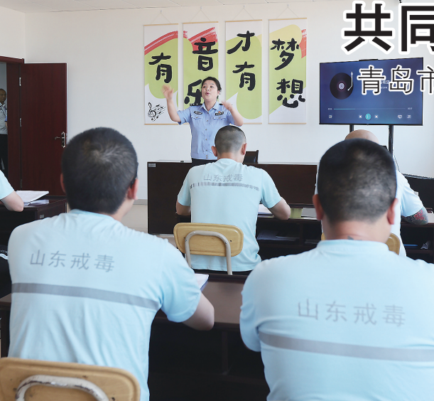
戒毒人员“和韵”文艺队自编自导自唱《迎接新希望》。

本报6月25日讯 6月24日,青岛市强制隔离戒毒所以“共同参与禁毒工作 构建全民禁毒防线”为主题,举行“6·26”国际禁毒日场所开放日活动,展示戒毒工作成效,搭建多方交流平台,广泛凝聚社会共识,营造全民关注、全民参与、全民支持禁吸戒毒工作的浓厚氛围。