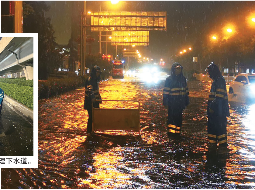
防汛人员深夜坚守岗位。