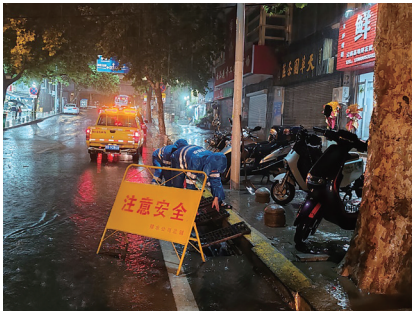
防汛人员昼夜坚守岗位。

受降雨影响,我市部分河道出现洪峰。根据市水文局发布信息,截至20日6时,本轮降雨全市大中型水库累计共进水约660万立方米。进水量较多的水库有:崂山水库进水211万立方米,产芝水库进水122万立方米,尹府水库进水75万立方米。截至6月20日6时,全市23座大中型水库(不含棘洪