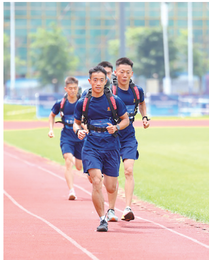
青岛机场斩获多项荣誉。

青岛机场将以此次竞赛为契机,把科学流程嵌入标准操作,持续提升队伍综合能力,加强与其他机场及地方消防力量的交流合作,为青岛机场安全运行筑牢应急防线。(青岛晚报/观海新闻/掌上青岛记者 徐美中)