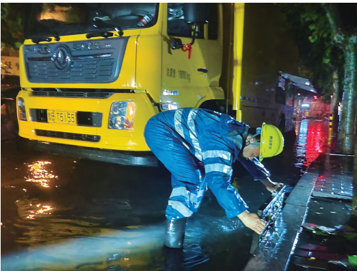
防汛人员疏通雨水篦子。

从19日下午开始,我市迎来强降雨天气。截至20日上午,本轮降水天气过程给我市带来了大到暴雨天气,成为入汛以来最大的一场降雨。为确保安全度汛,我市启动城市防汛二级应急响应。