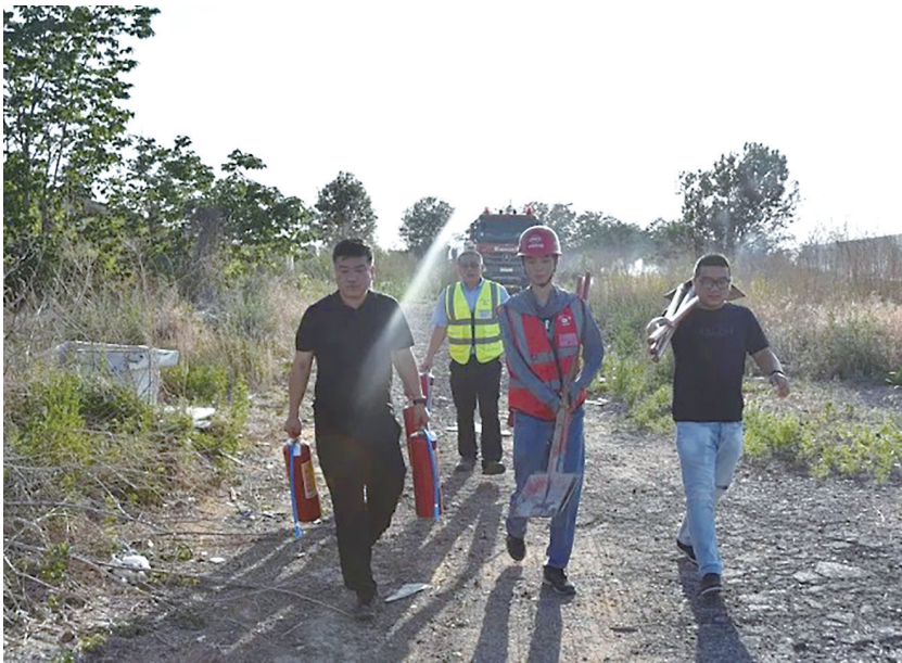
地铁建设者紧急扑灭火情。

本报6月18日讯 6月11日，某村附近荒地突发火情，火势迅速蔓延，直接威胁附近民房的安全。附近的青岛地铁9号线一期铁骑山出入段线建设者发现火情后，迅速启动应急预案，组织救援队伍携带消防器材，派出洒水车，开展紧急灭火，成功扑灭火情。