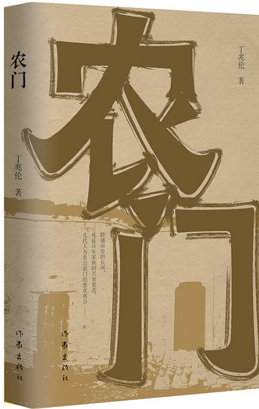
丁兆伦 著 作家出版社 2024年7月出版