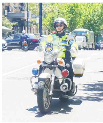
高考期间,交警将在考点周边确保道路安全畅通。