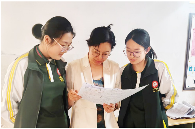
课间,负责答疑的高三老师被学生团团围住。

后天,2025年高考就将拉开大幕。按照惯例,市区大多数高中的高三学子于6月5日离校归家,在父母的关怀下,为高考做最后的准备。而在平度一中,每年高考前夕,大批留守校园的考生与始终朝夕相伴的老师,以拼搏和守护的姿态,共同演绎了温暖励志的高考故事。由于很多学生的家距离学校和考点较远,高考最后冲刺阶段,他们选择继续留在学校备考。在老师们的暖心陪伴下,顺利走完考前“最后一里路”。课间和晚自习的走廊里,一遍遍耐心的答疑;清晨和深夜的宿舍楼里,一声声“要睡好”的叮咛……高三教师们用晨昏守候的坚持、舍小家为大家的奉献和精益求精的匠心,为学子们的逐梦之路点亮盏盏明灯。