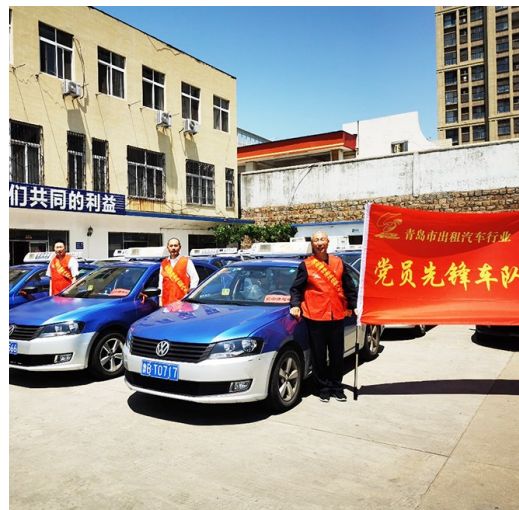
青岛海博公司派出50辆义运车。庄景海 摄

今年,青岛海博公司组织了50辆高考义运车,欢迎符合条件的广大考生预约,预约时间:6月4日至6日,每天上午9时至16时。预约电话:86101915。(青岛晚报/观海新闻/掌上青岛首席记者 张译心)