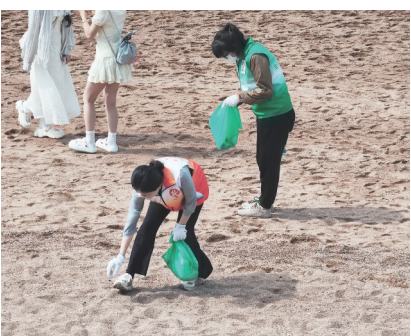
志愿者开展净滩活动。

截至目前，该协会组织127场科技环保社会实践活动，吸引6348名青少年参与。通过参观环境教育基地和环保设施，见证垃圾分类的重要性、绿色科技的应用以及人工湿地生态系统净化水质的作用等。在生命教育上，开展“地球银行·与动物重修旧好”“谢谢你，大树”等76场活动，3346人次参与。同时开展生