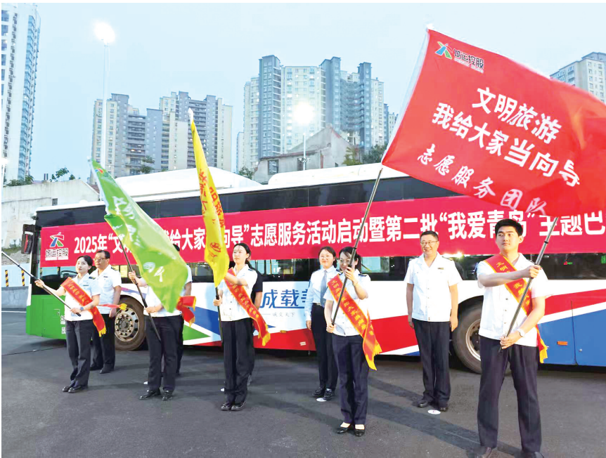
“文明旅游我给大家当向导”大型周末志愿服务行动启动。

近年来,城运控股公交集团以“公交+夜经济”融合发展为抓手,通过延时运营、精准接驳、服务升级等系列举措,