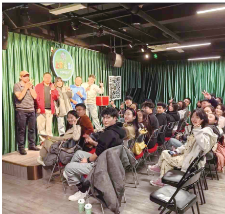
本土脱口秀厂牌“上客喜剧”。

这种模式迅速吸引特定客群。据“上客喜剧”统计,互动专场最受观众欢迎,许多观众将其视为社交的好去处,演出结束后自发组织聚餐、酒吧聚会。4月,“上客喜剧”与台东步行街管委会合作举办大型相亲互动活动,吸引了喜