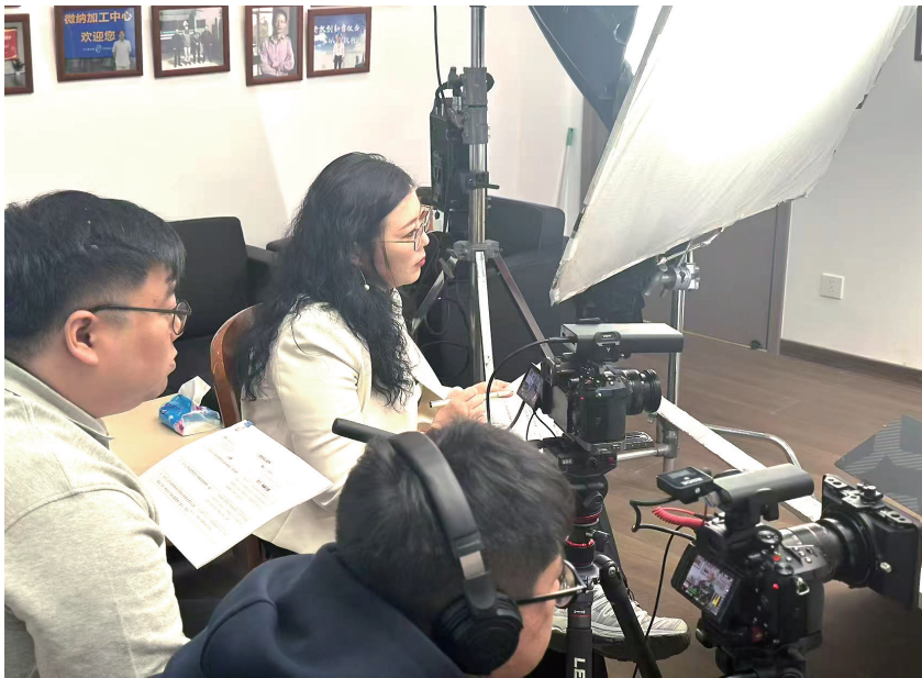
《王尽美在青岛》剧组在拍摄中。

经过阅读和学习,王绍君发现1923年至1925年期间,王尽美多次来青岛,指导青岛党组织组建和促成国民会议运动、工人运动,是他革命生涯中闪亮动人的坐标。王绍君决定以王尽美在青岛的这三年为主要线索,深入采访王尽美战斗工作的地方,包括原胶澳中学(现青岛1中)、天津路59号(原连升客栈)、四方机厂、李村路神州大药房等地,寻找他在青岛的革命足迹,跨过历史的时空,用一个80后所思所想与英雄穿越时空交流。通过探寻与王尽美在青岛革命工作有交集