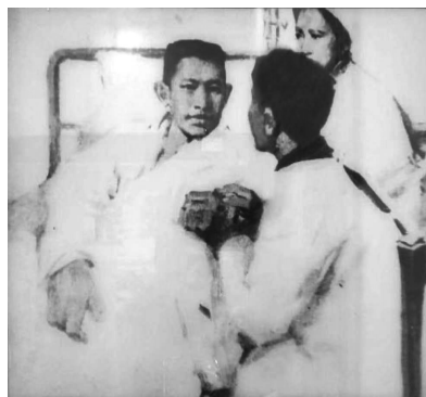
王尽美在青岛病逝时年仅27岁。

1925年7月,因病情恶化,王尽美在组织的安排下住进青岛病院(现青岛大学附属医院)。8月19日,这位年仅27岁的无产阶级革命家在青岛病院病逝。他的灵柩安葬于家乡诸城市北杏村。1959年7月,他的遗骸迁葬到济南英雄山烈士陵园。