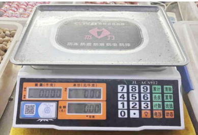
市场内赋有专属二维码的电子秤。

本报5月20日讯 5月20日是第26个世界计量日。计量是质量的基础、公平的标尺,关系百姓“菜篮子”“米袋子”“油瓶子”。今年以来,青岛市市场监管局聚焦民生领域持续发力,智慧监管创新突破,自主研发“计量智慧监管系统”,推行农贸市场“一秤一码”赋码管理,目前已覆盖98个市场14000余台电子秤,6月底前实现全市114个市场全覆盖。