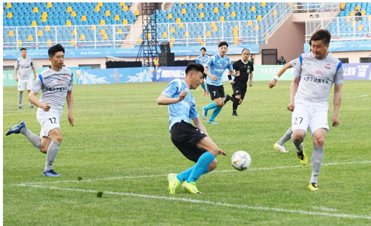
抖音足球嘉年华青岛站精彩上演。

如果说足球是“流量爆款”,那么市南区依托海洋资源打造的赛事矩阵,则是“长线投资”。克利伯环球帆船赛、中国摩托艇公开赛、全国海岸赛艇沙滩冲刺赛等十余项国际级赛事,每年吸引近千名国际运动员汇聚于此。以2024年为例,仅帆船类赛事就带动相