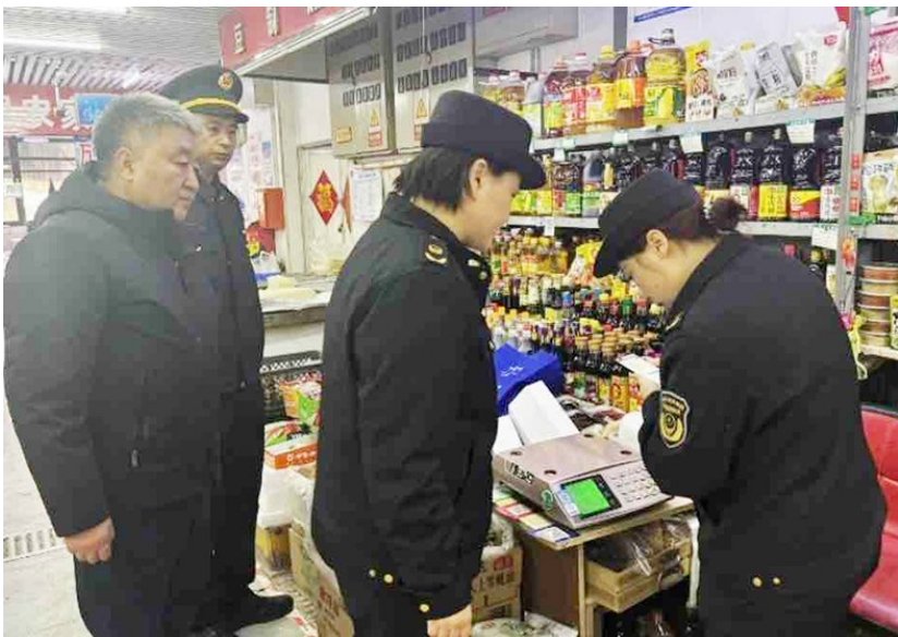
工作人员为秤赋码。

李沧区东山农贸市场周边居民区较为密集,是东山、北山居民名副其实的菜篮子。市民天天来买菜,长年累月都成了每个摊位的老主顾。“老主顾”是