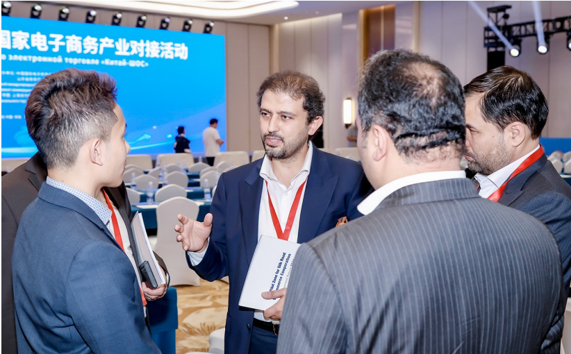
中国—上合组织国家电子商务产业对接活动现场。

活动现场,阿里巴巴、京东、快手科技等中国头部电商平台展示推介了特色资源与合作模式。伊朗、哈萨克斯坦、阿富汗、白俄罗斯等上合组织国家40余家企业与国内120余家电商企业围绕农产品、制造业、数字平台等领域开展“1对1”精准对接洽谈,以电子商务为载体,聚焦“供需对接+平台牵引+成果转化”,促进各成员国电子商务政策、标准与实践的交流互鉴,推动贸易