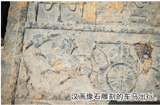
汉画像石雕刻的车马出行。