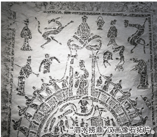
“泗水捞鼎”汉画像石拓片。