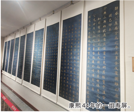
康熙44年的一组寿屏。

他开始筹建博物馆。2019年5月18日青岛海右博物馆如期开馆。2024年5月,海右博物馆被评为国家二级博物馆,成为青岛民营博物馆中的佼佼者。记者了解到,目前多数民营博物馆以民俗类收藏为主,主要保存和呈现乡村记忆,此外还有工业博物馆和红色题材博物馆。海右博物馆作为专业展陈古字画的博物馆能够成功晋级二级博物馆,非常难得。