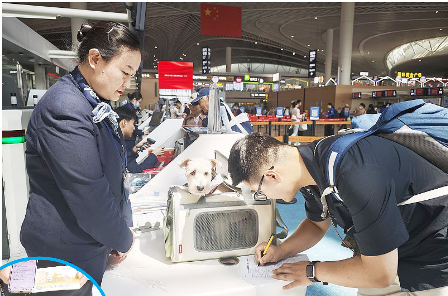
萌宠也能坐飞机了。