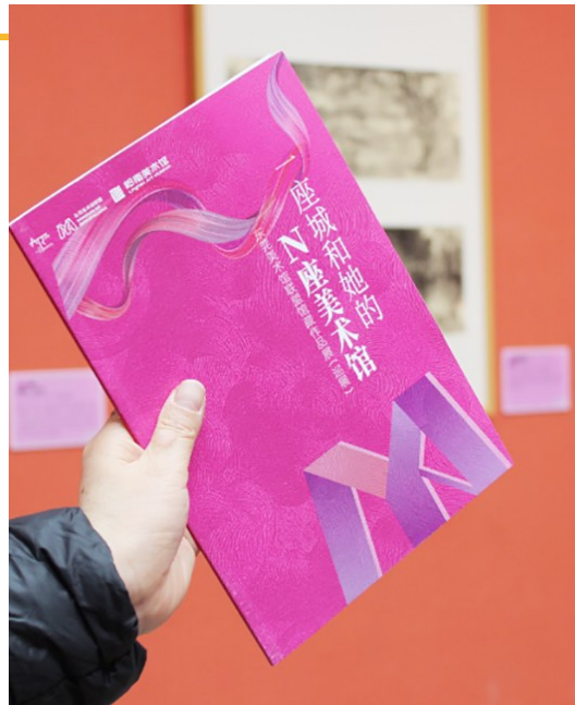
青島市美術館展出“一座城和她的N座美術館”。

青島市美術館五一期間推出的“藝術小工匠”系列活動，包括“大國工匠”手造紅牆體驗、“青青藝繪”美術館寫生以及“絲情畫意”潮T實驗室活動，讓遊客深度參與城市美學的創造。五一期間，青島市美術館