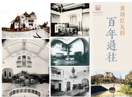
青島德國總督樓旧址博物館推出“黃牆紅瓦的百年過往”識圖打卡活動。

展出“一座城和她的N座美術館——東莞美術館聯盟藏作品展（巡展）”，東莞美術館聯盟各成員館獨具特色的百件館藏精品匯聚而成了本次展覽，展品涵蓋中國畫、油畫、書法、版畫、水彩等多元藝術門類，分為“根植嶺南”與“海納百川”兩大篇章，以“根脈與長河”為精神線索，串聯起東莞的藝術脈絡。同時，“2025西藏文化青島行——藏族唐卡藝術暨西藏風情圖片展”也在青島市美術館展出。展覽以“山海情深”為主題，共展出西藏當代優秀唐卡作品、青島援藏紀實和攝影力作共計400多件。