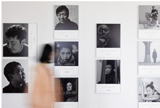
西海美術館展出《中國電影百廿肖像展》。