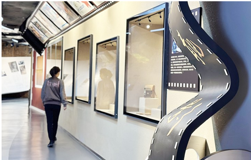
青島電影博物館推出“青島與中國電影120周年”電影主題展。

在電影镜头里觸摸城市肌理，于文物脈絡中追溯歷史回响，從非遺手作間感受匠心溫度……2025年五一假期，青島以“電影之都”的光影記憶為引，串聯起博物館、美術館、歷史建築等文化坐標，為市民與遊客勾勒出一幅“可看、可觸、可體驗”的城市文化地圖。跟着這份指南“沉浸式”漫遊，在山海之間解鎖屬於青島的獨特味道。