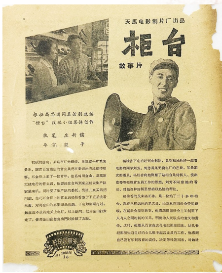
天马电影厂1966年拍摄的《柜台》电影说明书。

渤同样也从青岛走向全国乃至国际影坛,不仅在演艺事业上成绩斐然,还积极为青岛电影发声。