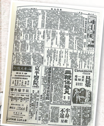
1935年，《法律外的航线》在《青岛民报》“每周电影”刊出。图片出自《青岛艺术史·文学史稿卷》。