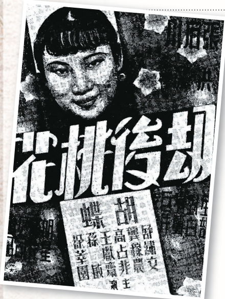
《劫后桃花》海报画稿。