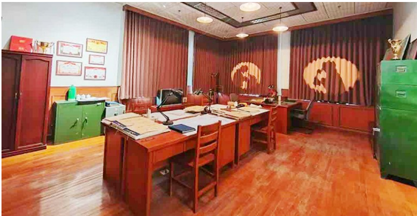
中车四方历史文化馆。

位于市北区杭州路16号的中车四方历史文化馆,是四方机厂1900园区内一处特色文化空间。“去年,我们在保留厂区原有风貌与特色的基础上进行了修缮和改造,融合现代科技与工业遗产,深入挖掘中车红色文化,可以说是老四方机厂改造升级的最新实践成果之一。”现场工作人员介绍,4月1日是中车四方历史文化馆试运营的第一天,前来参观的中小學生络绎不绝,“今年青岛‘萝卜·元宵·糖球会’期间,展馆曾开启了为期五天的对外开放,万余名游