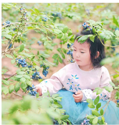
小朋友在采摘蓝莓。

本报4月11日讯 四月芳菲,蓝莓飘香。近日,山东省果业高质量发展(蓝莓)培训班暨2025年黄岛蓝莓采摘季在青岛西海岸新区拉开帷幕。本次活动以“科技驱动·品牌赋能·产业升级”为主题,通过产学研深度融合,展示青岛蓝莓产业高质量发展成果,探索乡村振兴与共同富裕的新路径。来自全省农业农村部门、科研院所、企业代表及媒体记者等150余人齐聚一堂,共谋蓝莓产业新未来。